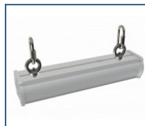
Кронштейн Diora Piton рым-болт (комплект)