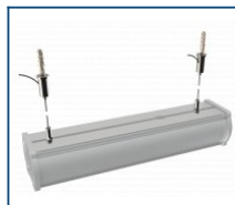
Кронштейн Piton тросовый подвес (комплект)